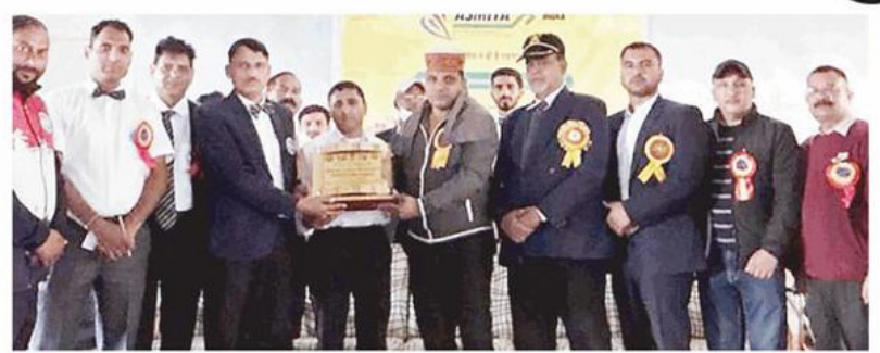
सुंदरनगर : महिला किक बॉक्सिंग विजेता टीम को पुरस्कृत करते मुख्यातिथि।